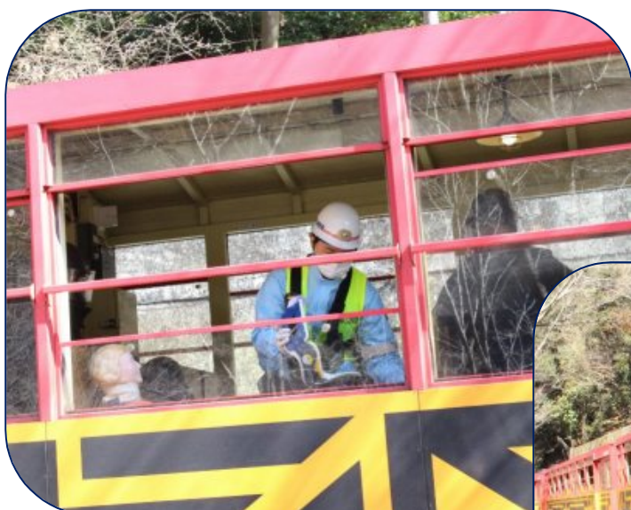
【警察・消防によるお客様の救出】

警察(鉄道警察隊、右京警察署)、右京消防署、JR 亀岡駅等と連携して爆破テロを想定した訓練を実施しました。