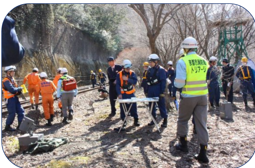
【警察・消防の現地本部】